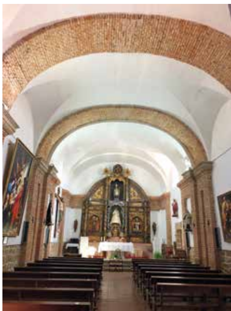
Fig. 4. Nave y retablo de la iglesia.

Terminadas las obras, llega por fin la inauguración de la iglesia el 25 de julio de 1830. El señor cura párroco, don José Ramos, hace una completa descripción de la fiesta que se celebró 32 .