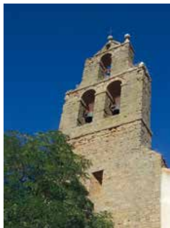
Fig. 2. Torre espadaña de la iglesia.

Según el plano realizado por el maestro arquitecto Francisco de Rivas (véanse apartado 5 e Fig. 3), la iglesia antigua constaba de una sola nave que seguía la disposición clásica este/oeste, con la torre de espadaña en su extremo occidental y con un transepto que cruzaba la nave central por su extremo oriental. En el lado izquierdo del transepto estaba la sacristía. Sus paredes son sólo de tierra, a excepción de la espadaña que cierra los pies de la figura, que es de buena y fuerte mampostería 8 .