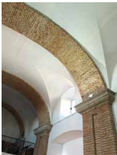
Fig. 6. Detalle del interior.

zadas. Los muros de la iglesia son de piedra, ladrillo y tapial. Cuatro ventanas facilitan el paso de la luz. En la parte occidental, sobre tres arcos, el coro que aumenta la capacidad de la iglesia. El suelo de la iglesia de baldosas de terracota (actualmente sustituido). La parte donde está el altar mayor se encuentra sobre elevada respecto al resto de la iglesia. En el templo se han ido haciendo obras de restauración y mantenimiento con cambios, algunos de ellos no muy acertados, pero acordes con la liturgia de los tiempos.