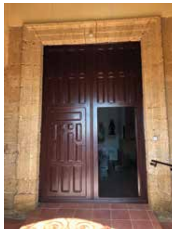
Fig. 5. Puerta de entrada a la iglesia.

La planta del edificio es rectangular, de diez metros de ancho por veinticuatro de largo, con cabecera recta como en otras iglesias diseñadas por Sánchez Pertego. El interior consta de una sola nave, cubierta por una bóveda de cañón con lunetas, que se sustenta sobre una serie de pilastras de ladrillo que refuerzan los muros. El zócalo, de mampostería arreglada. Las pilastras de ladrillo sobre sillares se rematan con cornisas de piedra, alguna de ladrillo, de donde parten los arcos fajones que refuerzan y forman parte de la bóveda de cañón. Es posible que las cornisas de piedra pertenecieran a la antigua iglesia y fueran reutili-