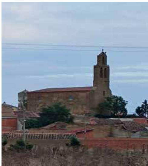
Fig. 1. Iglesia de Vega de Villalobos.

A finales del siglo XVIII la iglesia parroquial de Vega de Villalobos se encuentra en ruinas. Se trata de la única iglesia que hay en este pueblo de Tierra de Campos, de pocos vecinos, quienes difícilmente pueden sufragar la reconstrucción de nueva planta que necesita el templo dado su estado. Por este motivo los vecinos solicitarán financiación para las obras a los partícipes en diezmos de la parroquia: los Marqueses de Astorga, el Monasterio de Sahagún, la Catedral de León y otros. Éstos estaban obligados a financiar las obras cuando una parroquia no contase con suficientes ingresos, repartiéndose el coste en proporción a lo que ellos habían percibido de los vecinos del pueblo durante siglos. Fueron más de treinta años en los que los vecinos de Vega lucharán por conseguir la reconstrucción