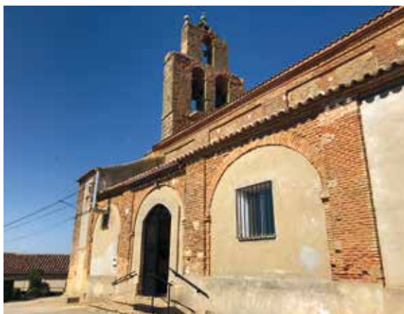
Fig. 7. Fachada meridional.

En el segundo cuerpo, dos vanos en forma de arco de medio punto en los que se albergan las campanas, la pequeña del año 1731 y la más grande del año 1777. En el tercer cuerpo, de igual forma y con un solo vano, está una pequeña campana que se conoce como el “esquilín”. Remata la espadaña un pequeño frontón con tronera sobre el que se yergue una cruz de hierro con veleta. La espadaña es lo único que se conserva de la antigua iglesia y necesita ser restaurada.