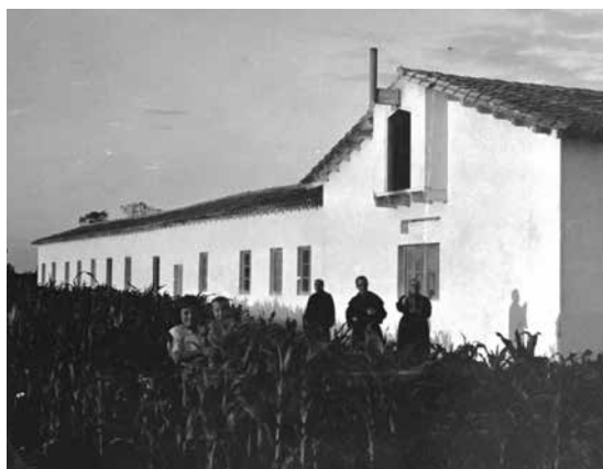
Fig. 1 Benavente Convento, APB.

El 3 de junio de 1949 el obispo de Oviedo, Benjamín Arriba y Castro 7 , concede permiso a los Carmelitas para hacer la erección canónica de un Convento-Colegio para la formación de los jóvenes estudiantes en la ciudad de Benavente y en el lugar llamado “Huerta de don Pío” 8 , que se encuentra a las afueras, en la carretera de León 9 . Unos días antes, el 1 de junio, el P. Florencio, prior de Oviedo, escribe 10 al Provincial de Burgos, P. Otilio del Niño Jesús comunicándole que el obispo ve con buenos ojos la ansiada fundación de Benavente. El obispo pide a los Carmelitas la conformidad del Vicario de Benavente. Afirmo que tanto el Vicario General de la Diócesis