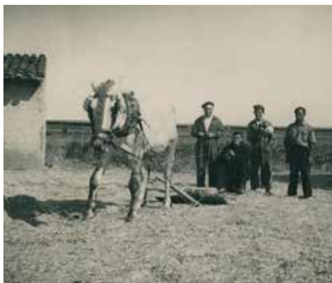
Fig. 2 Trillando.

También sabemos que los frailes arrendaban los pastos de la finca a ganaderos. Se conservan dos contratos de arrendamiento. El primero está firmado el 25 de octubre de 1956. Arriendan la finca