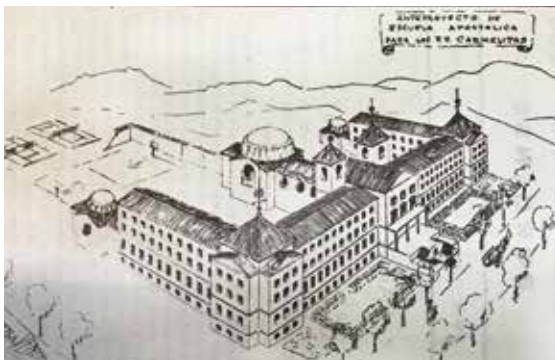
Fig. 3 Proyecto del Colegio Preparatorio de Benavente. Arquitecto Sr. Olano, BOPB.

El colegio que se pretendía construir, así quedó reflejado en 1951, tendría 110 m. de fachada y 45 m. de fondo. Constaría de una planta y tres pisos. Tendría una capacidad para 200 niños y 27 celdas (habitaciones) para profesores y hermanos de servicio. Se situaría en medio de la finca de la Gándara y tendría una capilla semipública sin acceso a los seglares. El arquitecto que diseñó los planos fue D. José Antonio Olano 48 . (Fig. 3).