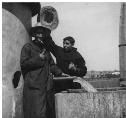
Fig. 5 Pozo de la finca. PP. Benito y Eduardo, APB.

Yo lo único claro que veo, es que un padre (ahora dos) y cuatro Hermanos – los más capaces de la Provincia en menesteres agrícolas – no son capaces de sacar a una finca de 9 hectáreas ni siquiera lo suficiente para sostenerse, pues la Provincia no percibe más que deudas de más de un millón que tiene empleado ahí, y que el rédito del 4% daría de sobra para mantener una Comunidad triple que esa y sin finca. Este es el misterio que no comprendo. La excusa de las deudas atrasadas es tan socorrida como poco eficaz. (Fig. 5).