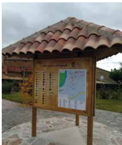
Edículo con cartelería sobre Castrogonzalo.

Muchos de los visitantes a la localidad llegan atraídos por los grafitis de Parsec (Antonio Feliz) y en muchos casos no disponen de mapas para localizar los murales, por lo que al alcalde se le ocurrió esta idea. En el primer panel se sitúa en un mapa la posición de los grafitis junto a imágenes,