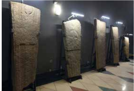
Exposición de laudas sepulcrales en el teatro Reina Sofía de Benavente

Tumba n° 5. Rota en su parte central. Decoración arrasada que parece reproducir, de forma muy tosca, la de la n° 3, identificándose un segmento circular arriba y franjas verticales abajo.