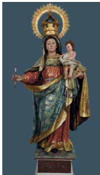
Virgen del Rosario procedente del convento de Sancti Spiritus de Benavente, hoy en Marmolejo (Jaén)