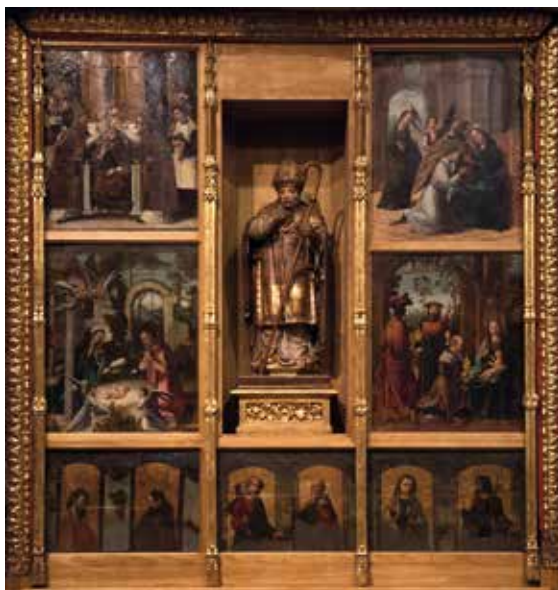
Retablo de San Ildefonso después de la restauración.

La intervención se ha llevado a cabo por pérdida de estructura original y montaje incorrecto en obra metálica del retablo que impedía, entre otros problemas, desmontar las tablas pictóricas con facilidad. Se procedió, pues, en primer lugar, al desmontaje del retablo y sustituir dicha estructura de hierro por otra de madera sobre la que se colocaron las pinturas. Posteriormente se realizó una limpieza superficial de polvo en anverso y reverso aplicándole un tratamiento preventivo antixilófagos, fijación puntual de capas pictóricas de tablas del banco, reintegración cromática de molduras y pilastras mediante regatino en zonas doradas, aguadas con acuarelas allí