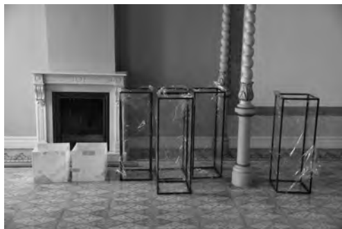
Lám. 1. Peanas y otros materiales para el montaje de la exposición.

A primera hora del miércoles 9 de Mayo comienzan a llegar las primeras vitrinas y paneles para el montaje, todo de nueva planta y a medida para la tan deseada exposición que finalmente podía llevarse a cabo. El evento y la espera de tantos años lo merecía. Para el CEB “Ledo del Pozo” realmente era un reto y un enorme esfuerzo tanto a nivel económico, logístico y de trabajo, pero como decía antes, para una vez que un gobierno municipal escuchaba y mostraba interés colaborando con una partida económica, había que hacerlo y hacerlo bien, como se merecía la colección y sobre todo el propio Nicasio. Los días 9, 10 y 11 de Mayo fueron de mucho trajín para que todo estuviese a punto para la inauguración. Fueron días que no se les veía fin