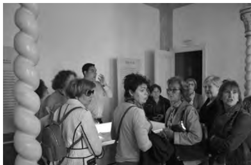
Lám. 2. Visita de alumnas de la Universidad de la Experiencia.