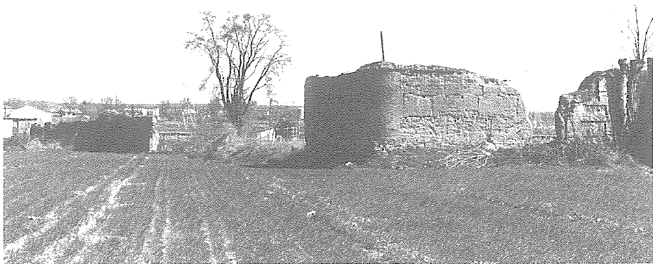
Fig. 1.- Restos del monasterio de San Jerónimo