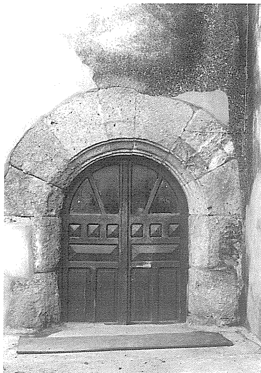
Fig. 3.- Puerta. Monasterio de San Jerónimo