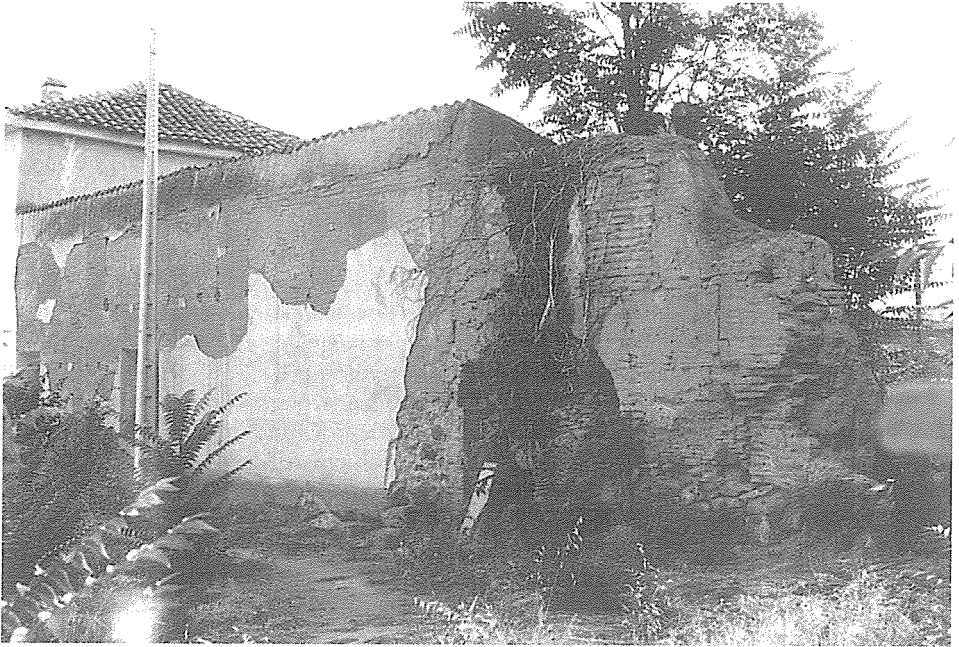
Fig. 4.- Cerca. Detalle

sobre el hedeñio del monesterio de San Jeronimo en esta villa” 24 . Poco después, el 10 de marzo, y ante Toribio de Palacios, escribano de número de Benavente, se hicieron las escrituras de concordia y capitulaciones con el conde, concejo y regimiento benaventano. Con esta misma fecha, el concejo de Benavente daba carta de vecindad a los frailes de San Jerónimo: