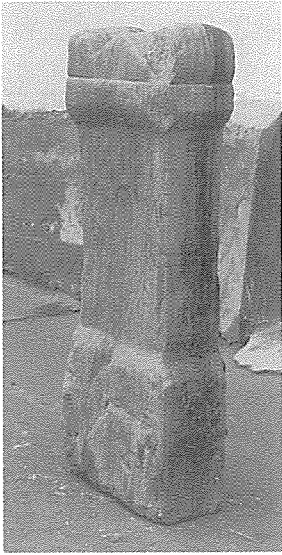
Foto II.- Vista lateral

en yacimientos situados en localidades, no lejos de Castrogonzalo, como “Petavonium”, (Rosinos de Vidriales); Asturica Augusta (Astorga) o Lancia (Villasabariego).