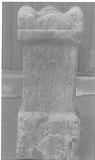
Foto 1.- Vista frontal

Tampoco podemos fecharla con exactitud, aunque con toda probabilidad date de los siglos I ó II de nuestra era, como otras aras encontradas